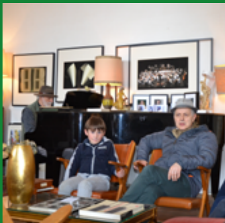
PALAZZO SERGARDI BIRINGUCCI

TEATRI E CANTANTI TRA PASSATO E PRESENTE A SIENA