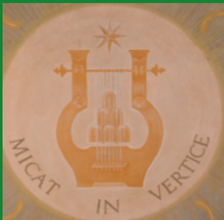
ACCADEMIA MUSICALE CHIGIANA