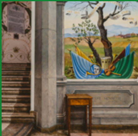
INGRESSO TEATRO DEI ROZZI

Senza tacere di istituzioni cittadine legate alla musica, testimoni della vitalità artistica della città, come il Conservatorio Rinaldo Franci e il Siena Jazz, luoghi di formazione di tanti musicisti senesi, e non, e realtà come l'Orchestra a plettro e l'Unione corale.