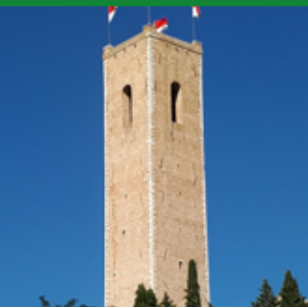
TORRE DEGLI SMEDUCCI CASTELLO AL MONTE (XIII SEC.)