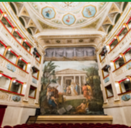
TEATRO FERONIA, PIAZZA DEL POPOLO (XVIII SEC.)