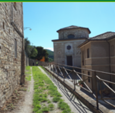
CHIESA DI S. TERESA - MONASTERO SUORE CONVITTRICI BAMBIN GESU (XVII SEC.)