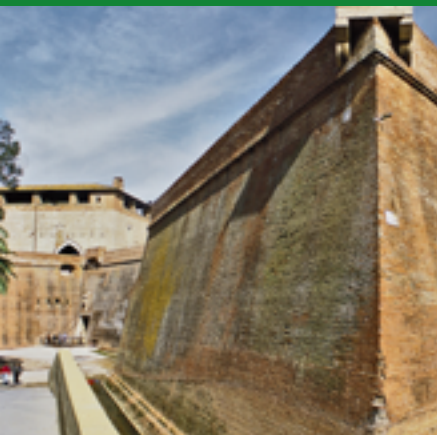
FORTEZZA MEDICEA, BASTIONE DELLA VITTORIA