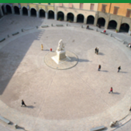
PIAZZA DANTE ALIGHIERI