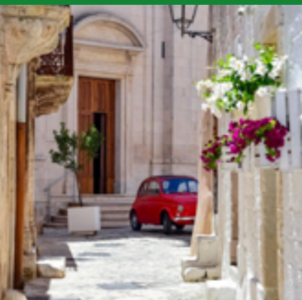
VICOLO DEL CENTRO STORICO