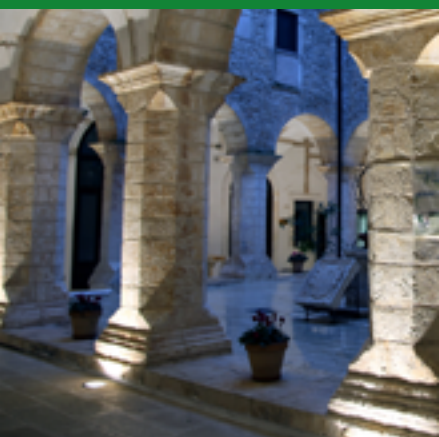
MED COOKING SCHOOL