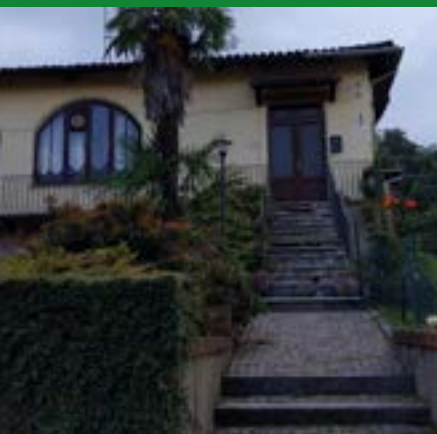
SEDE SOCIETÀ SPORTIVA LA BUFAROLA