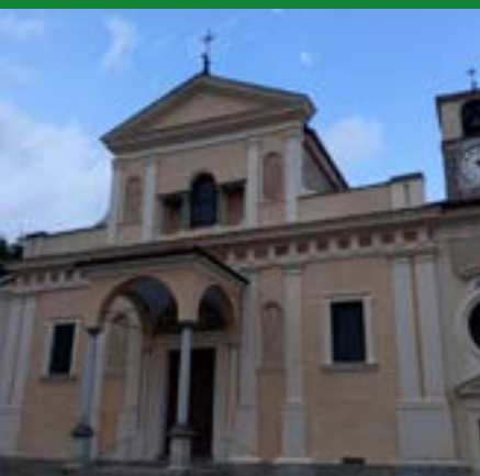
CHIESA PARROCCHIALE COSSILA SAN GRATO