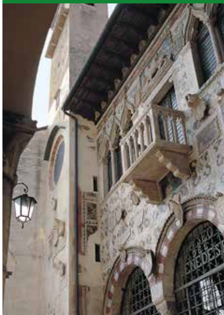
FACCIATA MUSEO DEL CENEDESE VITTORIO VENETO