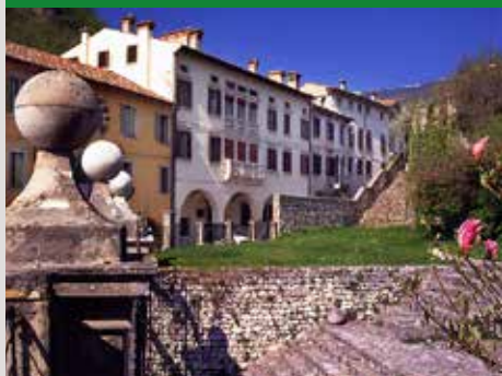
PALAZZI DI VIA ROMA