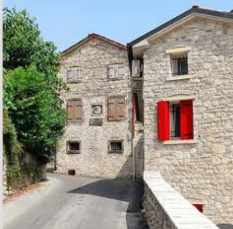
CASA NATALE DI UGO ANGELO CANELLO