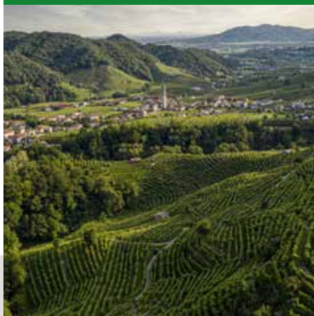
BORGO DI GUIA, COLLINE UNESCO, (FOTO DI P. CHIODERO)