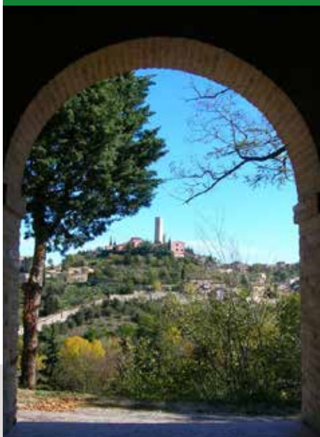
CASTELLO AL MONTE