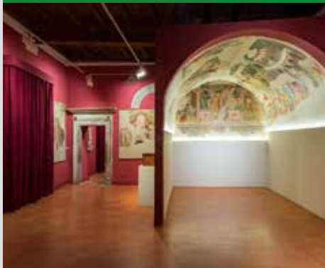
PINACOTECA CIVICA 'P. TACCHI VENTURI'