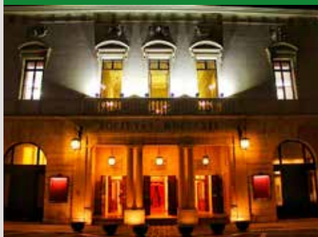
TEATRO SOCIALE