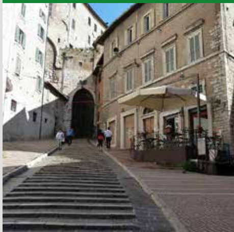
SCALETTE DI SANT'ERCOLANO