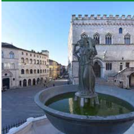
FONTANA E CORSO VANNUCCI