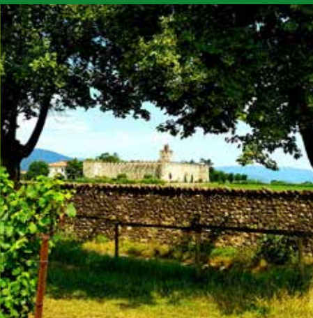
CASTELLO DI PASSIRANO