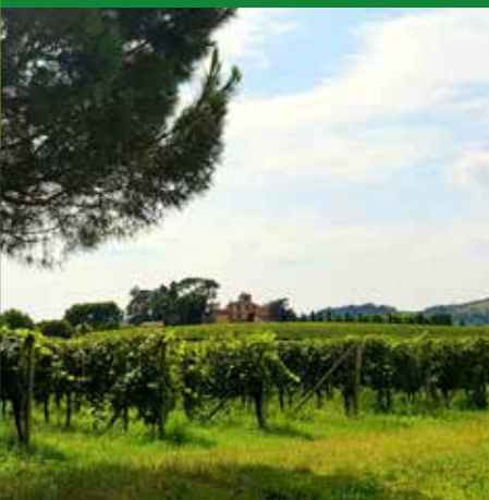
PALAZZO DUCCO CATTURICH