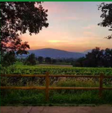
PANORAMA DI PASSIRANO