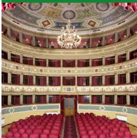
TEATRO MANINI