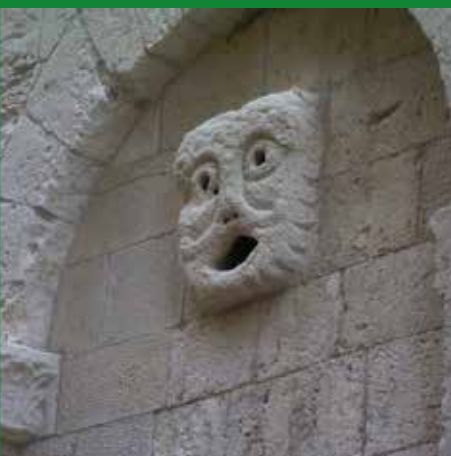
DOCCIONE DUOMO DI MOLFETTA