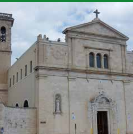
COMPLESSO BASILICALE MADONNA DEI MARTI