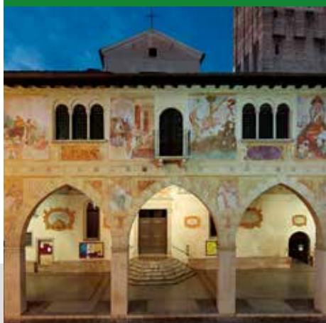
FACCIATA DUOMO DI CONEGLIANO