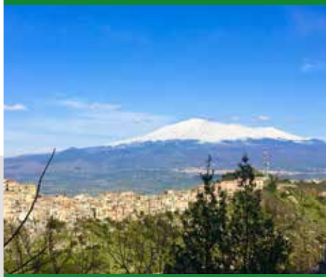
CENTURIPINE CON SFONDO DELL'ETNA