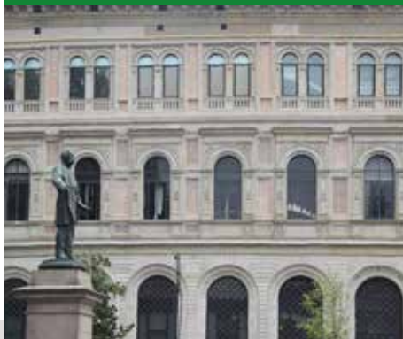
PALAZZO DI RESIDENZA DELLA CASSA DIRISPARMIO IN BOLOGNA