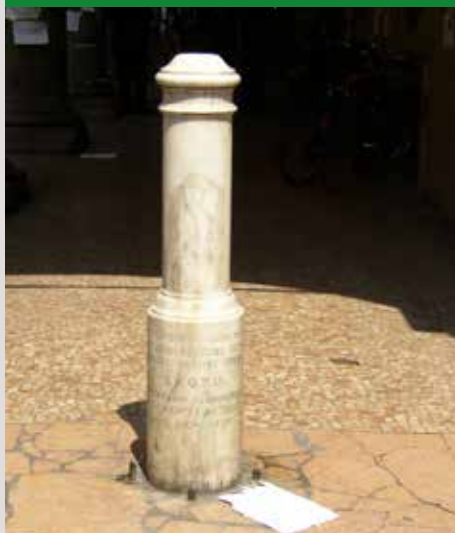
IL DIVIN FITTONE" IN VIA ZAMBONI