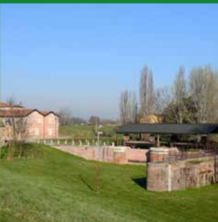
CONCA DEL BERTAZZOLO