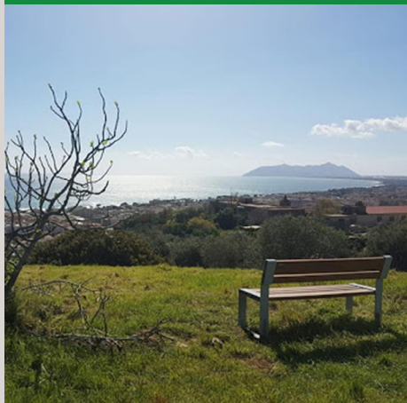
PARCO DELLA FOSSATA