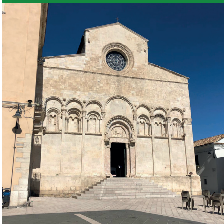
CATTEDRALE DI SANTA MARIA DELLA PURIFICAZIONE