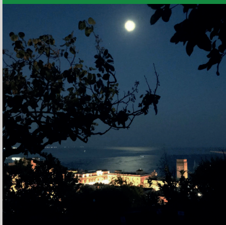
SALERNO VISTA DAL PLAIUM MONTIS