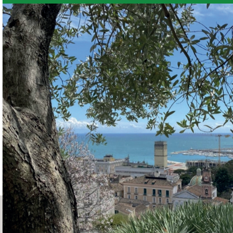
CHIESA DELL'ANNUNZIATA E RIONE PORTA ROTESE