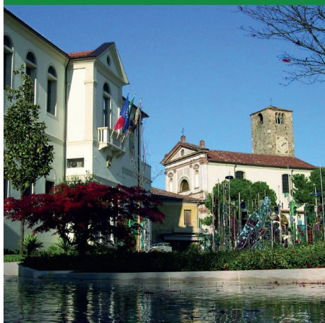
COMUNE DI MONTEGROTTO TERME