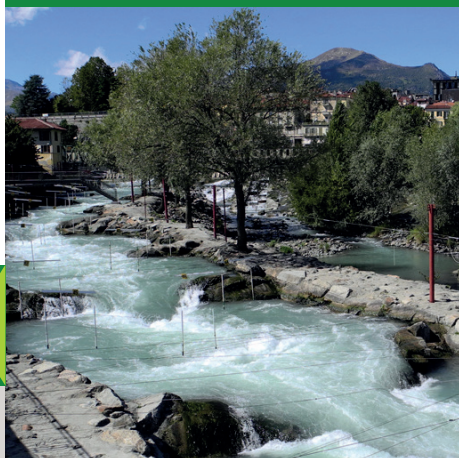
STADIO DELLA CANOA LUNGO IL FIUME DORA BALTEA