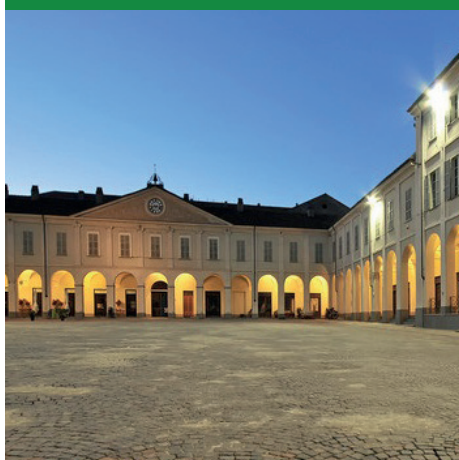
PIAZZA OTTINETTI