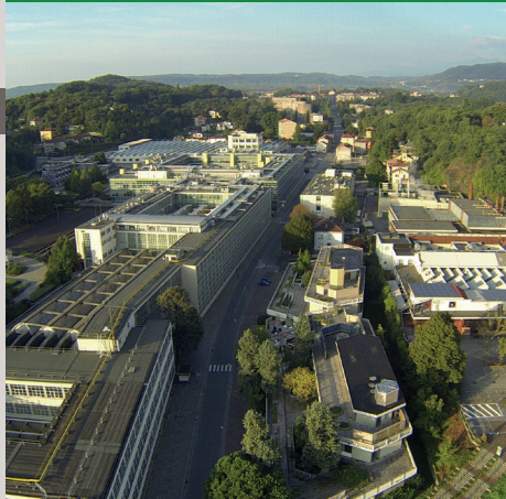
IVREA, CITTÀ INDUSTRIALE DEL XX SECOLO