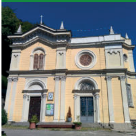
CHIESA DI SAN GIUSEPPE

Arrivati alla frazione Cossila Gilardi si ritorna verso il centro cittadino.