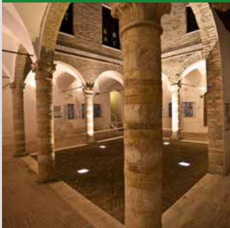
CORTILE PALAZZO ODASI