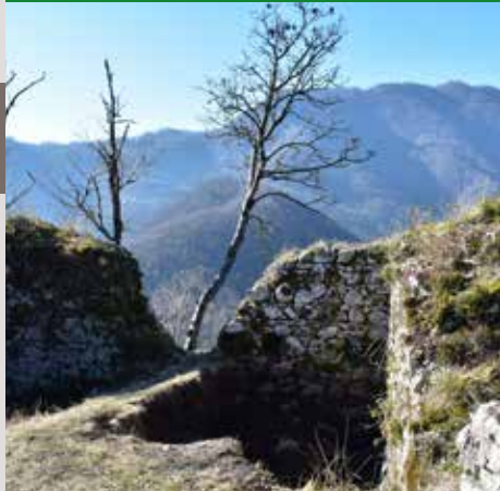
VISITA DAI RUDERI DEL CASTELLO