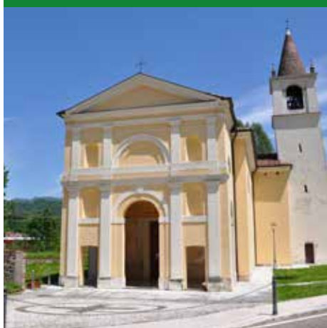
L'ANTICA PIEVE DI BELVICINO