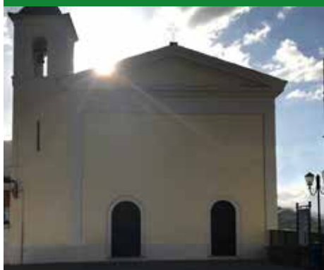
CHIESA DI SANTA MARIA DEI LONGOBARDI