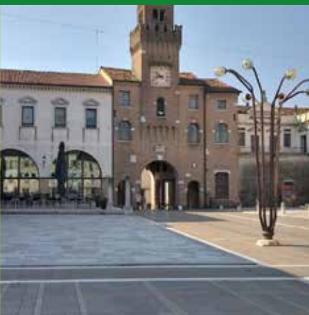
PIAZZA GRANDE – IL "TORRESIN"