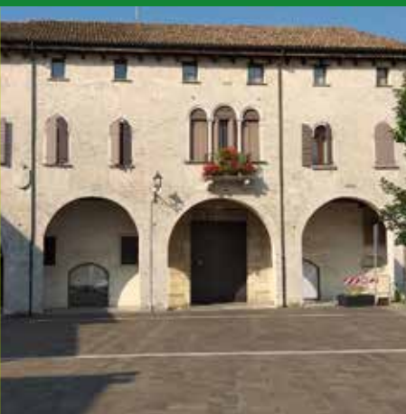
PALAZZO PORCIA IN PIAZZA CASTELLO