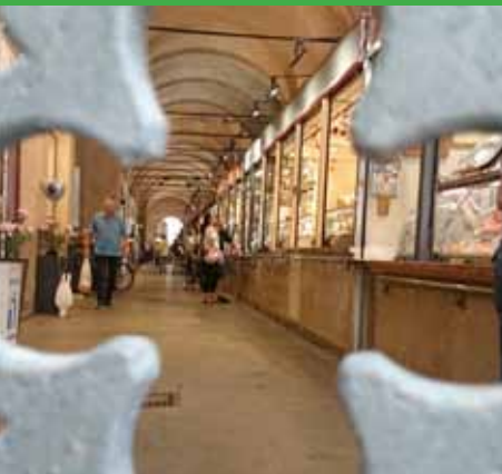
BOTTEGHE SOTTO IL SALONE CON QUADRILOBO *

L'itinerario seguirà la tematica proposta sviluppandosi su diverse prospettive: artistica, culinaria e scientifico-botanica. Si inizierà con la visita al Palazzo della Ragione per scoprire le curiosità culinarie trecentesche affrescate in alcuni riquadri del ciclo astrologico del Salone. Si proseguirà con i luoghi millenari del commercio degli alimenti, i mercati delle Erbe e della Frutta e le botteghe alimentari sotto il Salone. Si raggiungerà Palazzo Zuckermann, per ammirare utensili e corredi da cucina, tra cui una dote monacale per recarsi poi al refettorio settecentesco del Collegio delle Dimesse e quello quattrocentesco di Santa Giustina, attraversando via delle Acquette, dove nel Medioevo si allevavano pesci d'acqua dolce. Infine l'Orto Botanico, bene Unesco, con la sua varietà di piante aromatiche, e il nuovo Giardino della Biodiversità, per scoprire l'origine di alcune piante commestibili, la provenienza e le caratteristiche botaniche e nutrizionali di frutti e verdure entrati nella nostra alimentazione quotidiana.