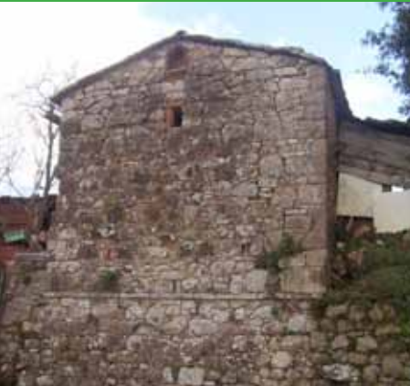
CAPPELLINO DI S. NICOLA