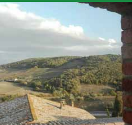
POGGIO CIVITATE DAL MUSEO