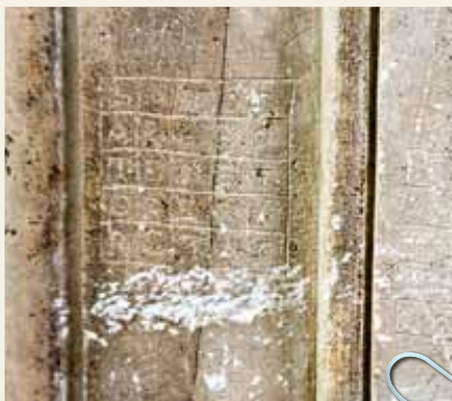
SATOR PALAZZO DUCALE