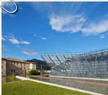
LE ALBERE HUFTON&CROW