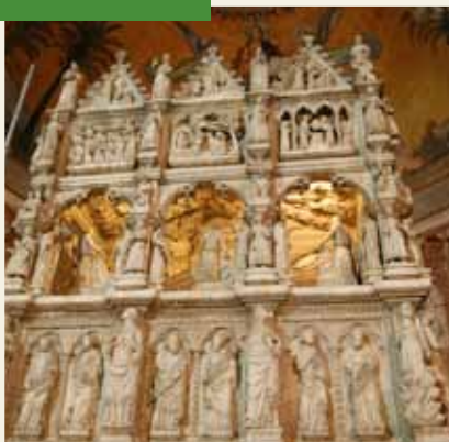
ARCA DI S. AGOSTINO (BASILICA DI S. PIETRO IN CIEL D'ORO)

Seguendo la narrazione di Paolo Diacono, ripercorriamo le vicende dei sovrani longobardi a Pavia. Il percorso si snoda tra i vicoli del centro storico, seguendo le tracce della presenza longobarda evocata nelle antiche lapidi e nei nomi delle vecchie contrade. Un itinerario alla scoperta del leggendario Re Alboino che fece il suo ingresso in città a cavallo, sulle tracce dell'origine del dolce della "colomba" e dell'immagine del misterioso angelo della peste, passeggiando nei pressi del luogo ove sorgeva il palazzo reale, ricalcando i passi dei sovrani incoronati nella Basilica di San Michele. Ritroveremo nella chiesa di San Pietro in Ciel d'Oro la sepoltura del re Liutprando, che fece arrivare a Pavia le sacre reliquie di Sant'Agostino. Sulla soglia del monastero di San Felice ricorderemo Ermengarda, leggendaria figlia di Desiderio, ultimo re dei Longobardi.