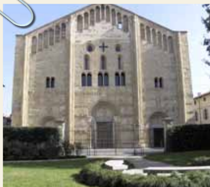
BASILICA DI S. MICHELE MAGGIORE