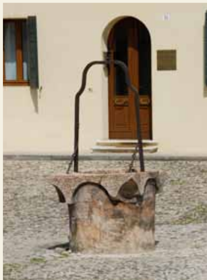
POZZO CAMPIELLO DEL DUOMO

Scopri il ricco calendario di eventi su www.trekkingurbano.info