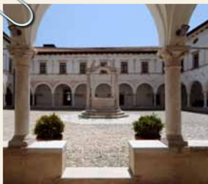
EX CONVENTO DI SAN FRANCESCO - CHIOSTRO