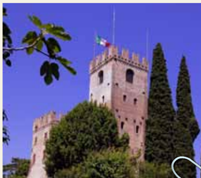
TORRE DEL CASTELLO