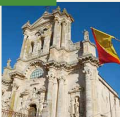
CHIESA SANTA M. MADDALENA SEC. XVIII

A Buccheri sembra di passeggiare all'interno di un libro. Partendo dalla centrale Piazza Roma si visita l'antica fontana dei "Quattro Canali" costruita nel 1585 e si prosegue fino alla Chiesa di Sant' Andrea risalente al XII secolo. Nel mezzo del nostro cammino attraversiamo antiche viuzze in pietra lavica e scorci urbani dalla tipica impronta medievale per passare poi in mezzo ad un paesaggio naturalistico di incontaminata bellezza. Si prosegue alla scoperta di chiese, palazzi, grotte e altri luoghi unici riscoprendone la storia, i miti e le leggende. Dai Siculi agli Arabi, dal Medioevo al Barocco, un itinerario che appaga tutti i sensi.