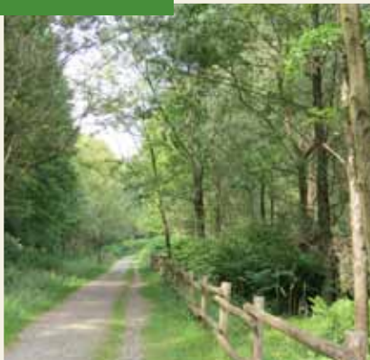
PARCO DEL BELLONE

Le acque biellesi, siano esse di fiumi, di laghi o semplicemente di roggia hanno offerto fin dal periodo celtico spunti per leggende popolari sugli spiriti, non sempre benefici, che le popolano. L'itinerario propone un misterioso viaggio, guidato e teatralizzato, che partendo da Piazza Colonnetti, percorre la salita dei Cappuccini e arriva al Botalino dove si incontrano tre giovani lavandaie dedite al lavoro. Si prosegue all'interno del parco del Bellone attraversando l'area dove fu edificato nella seconda metà dell'800 il cotonificio 'Coda' che diventò negli anni '60 proprietà della famiglia Bertrand. Attraversando il parco, nei pressi della roggia tutto può accadere! Si risale al borgo storico del Piazza attraverso il vicolo del Bellone e si arriva nella centrale Piazza Cisterna circondata da portici. Il percorso si conclude nel cortile dell'Ostello, un tempo sede delle carceri cittadine, con degustazione di un aperitivo tipico.