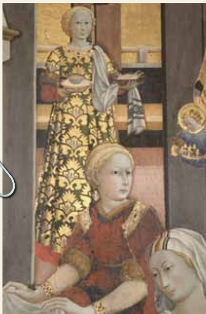
PARTICOLARE DELLA "NATIVITÀ DELLA VERGINE" DEL MAESTRO DELLOSSERVANZA. MUSEO PALAZZO CORBOLI.

Scopri il ricco calendario di eventi su www.trekkingurbano.info