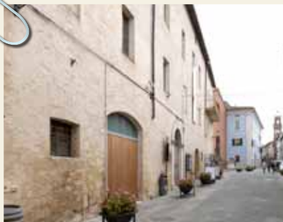
CORSO G. MATTEOTTI, MUSEO PALAZZO CORBOLI

Scopri il ricco calendario di eventi su www.trekkingurbano.info