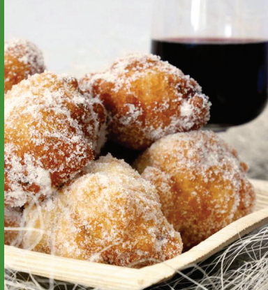
FRIITIEDI DI SAN MARTINO

Alla fine di ciascun percorso, presso la Scuola di Cucina Mediterranea NOSCO e la sede dei Cenacolari dell'Antica Contea, la degustazione di specialità della tradizione culinaria locale richiederà dolci e pietanze preparati in occasione di specifiche festività religiose come ad esempio "I Mucatuli" biscotti natalizi preparati per Santa Lucia, "I Frittiedi ri San Martinu" accompagnate col vino novello e "L'ossa re muorti" per Tutti i Santi.