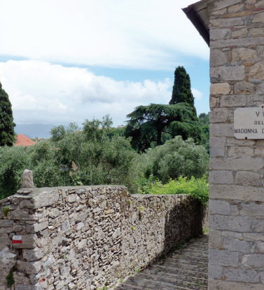
LE SCALINATE DI FABIANO ALTO