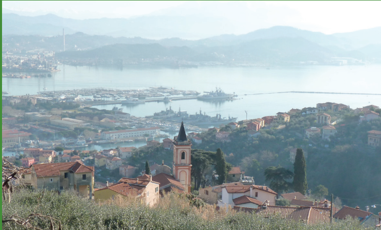
FABIANO ALTO CON LA CHIESA DI SANT'ANDREA E PANORAMA DEL GOLFO

Le profonde trasformazioni della città storica, dapprima con la costruzione dell'Arsenale, poi con la Seconda Guerra Mondiale, hanno coinvolto pesantemente anche i luoghi della spiritualità, gli antichi edifici religiosi frequentati da generazioni di spezzini. Con l'aiuto di cartografia storica e delle guide turistiche AGTL realizzeremo un viaggio a ritroso nel tempo nel tentativo di ricostruire gli antichi percorsi.