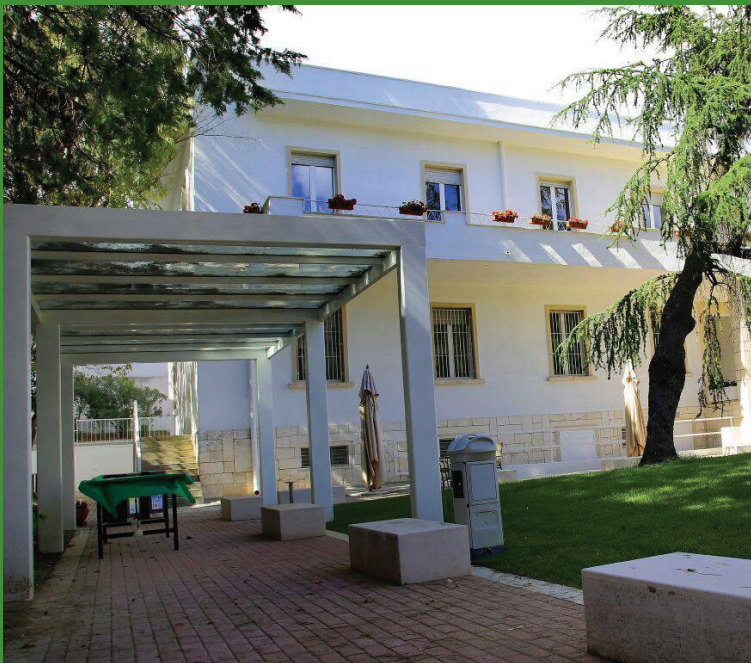
MUSEO ARCHEOLOGICO E DI ARTE CONTEMPORANEA