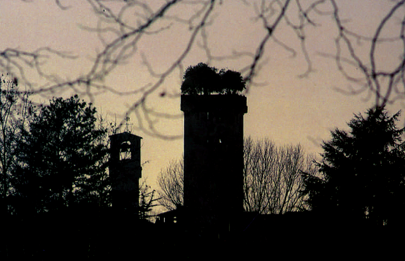
Torri di notte