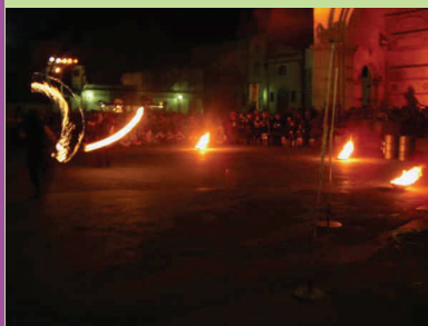
Giochi di fuoco in San Martino