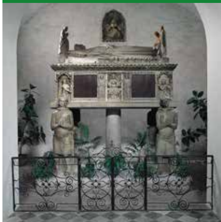
MONUMENTO DI RIZZARDO SANTA GIUSTINA

Gusteremo la bellezza di camminare in un paesaggio ricco di storia e di bellissimi scorci naturalistici!