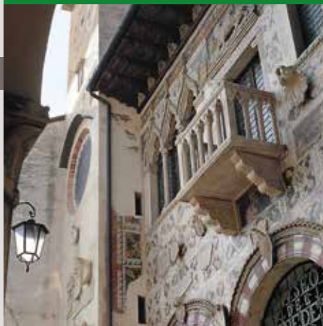
SERRAVALLE, MUSEO DEL CENEDESE