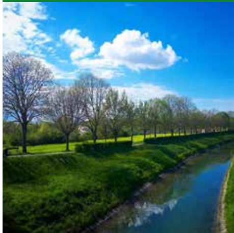
SCORCIO FIUME ADIGETTO

POP OUT Cultura Arte Turismo Cel. 391 4983435 info@pop-out.it