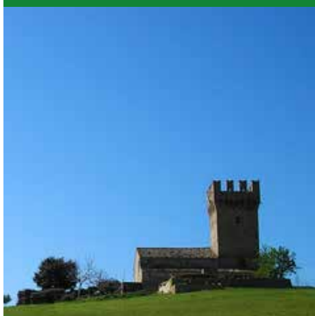
TURRIS SPECULATRIX (TORRE MATTEUCCI)