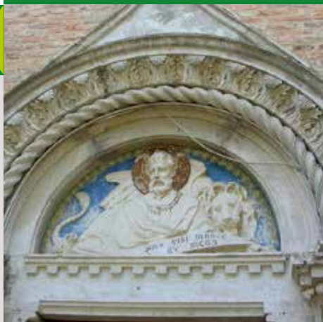
SAN MARCO (LUNETTA ESTERNA)

FERMO È SITO UNESCO Learning City IL BORGO DI TORRE DI PALME, FRAZIONE DI FERMO, È TRA I BORGHI PIÙ BELLI D'ITALIA.