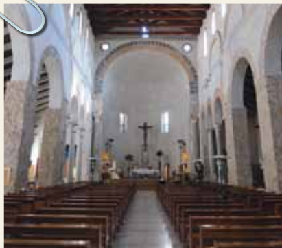
CHIESA DI SAN BENEDETTO