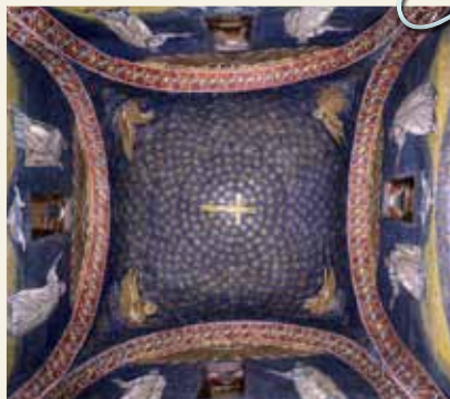
MAUSOLEO DI GALLA PLACIDIA