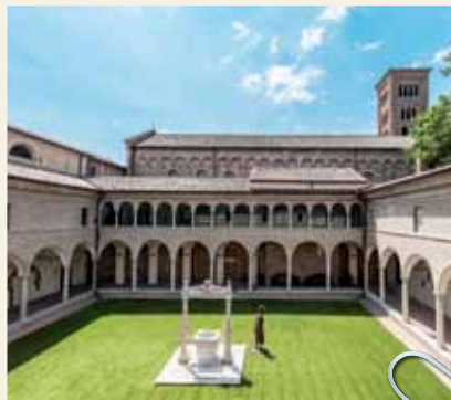
ANTICHI CHIOSTRI FRANCESCANI