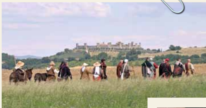
A PASSEGGIO NELLA STORIA