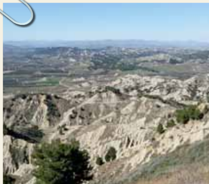
RISERVA NATURALE SPECIALE DEI CALANCHI