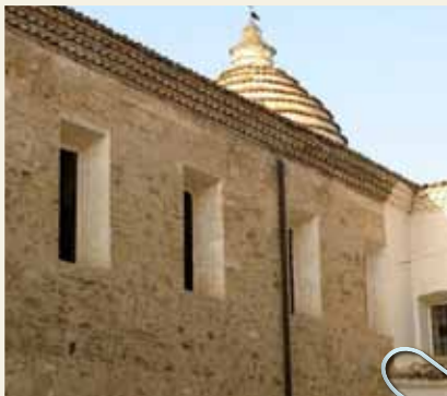
CHIESA MADRE "SANTA MARIA DELL'EPISCOPIO"