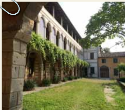
INTERNO PALAZZO BARBERIS-RUSCA