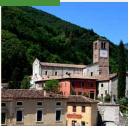
ABBAZIA DI FOLLINA

L'Abbazia Cistercense di Follina, nota dal 1146 come filiazione della più prestigiosa Chiaravalle di Milano, fu teatro di grandi splendori, sotto il patrocinio dei conti da Camino, ma fu anche teatro di assassini e ladrocin. Per il trekking urbano 2017, la città di Follina propone la rievocazione in chiave misteriosa di un fatto accaduto nel medioevo e che ancora oggi è avvolto nel mistero. Durante e al termine della rappresentazione sono previsti dei ristori con il prodotto tipico del posto, il Prosecco Superiore DOCG e specialità del posto. A Follina la storia e la cultura si incontrano per tramandare ai visitatori il fascino di storie millenarie.