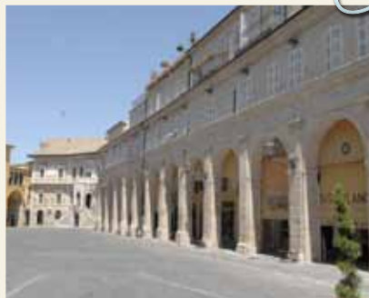
PIAZZA DEL POPOLO