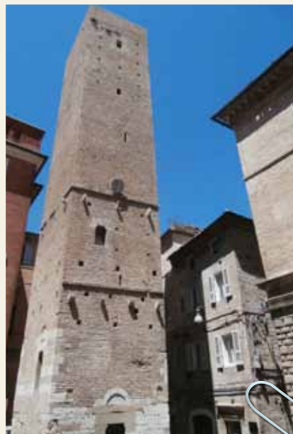
FERMO TORRE MATTEUCCI